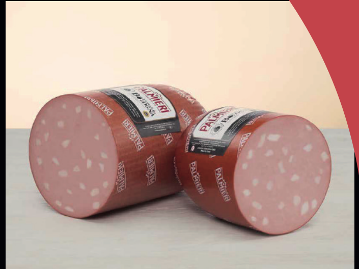
Mortadella Bologna IGP