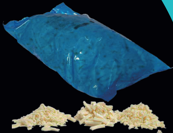
Julienne / cubettato di vacca