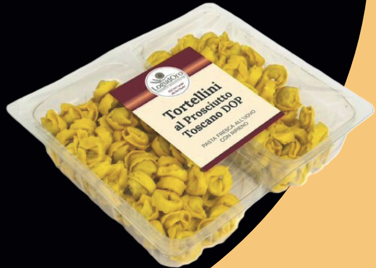
Tortellini al prosciutto toscano DOP