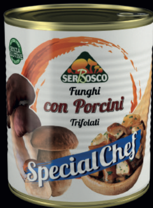
Funghi con porcini trifolati