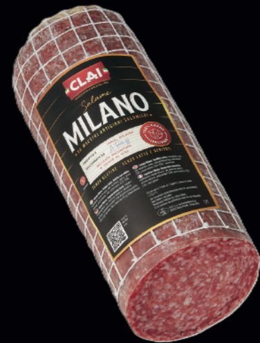
Salame Milano bollino rosso