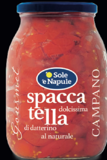
Spaccatella di datterino al naturale