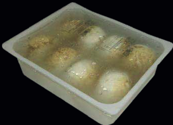
Mozzarella di Vacca affumicata