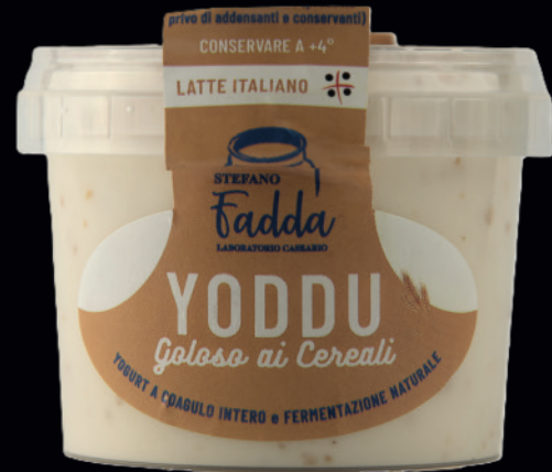
Yoddu ai cereali