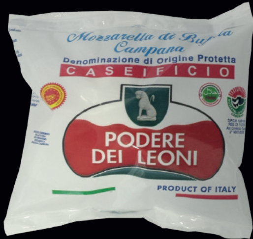
Bufala di bufala campana DOP