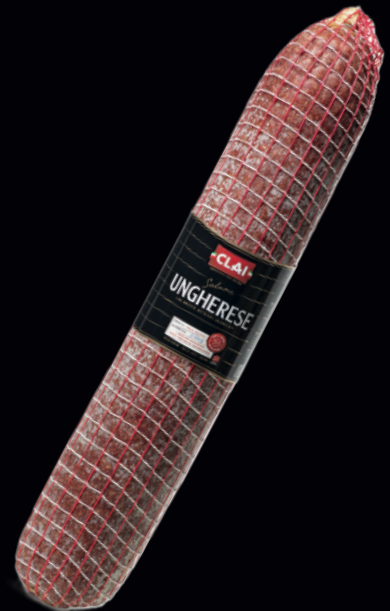
Salame Ungherese bollo rosso