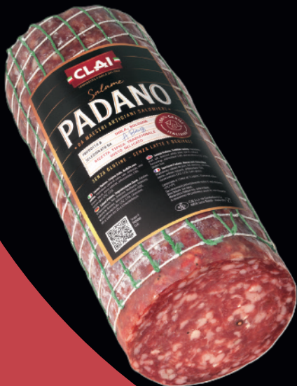
Salame Padano 4kg