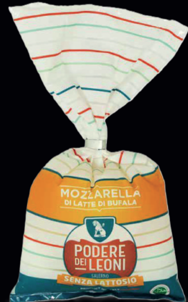
Mozzarella di latte di bufala senza lattosio