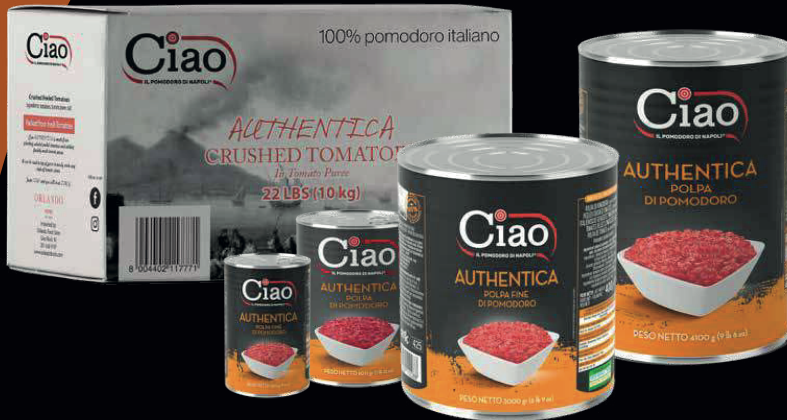
Authentica, polpa di pomodoro