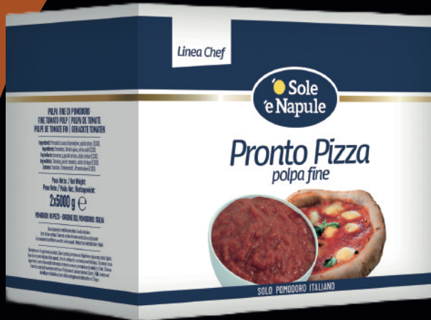
Pronto pizza, polpa fine di pomodoro