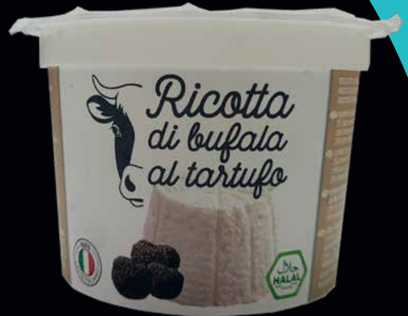
Ricotta di bufala tartufata