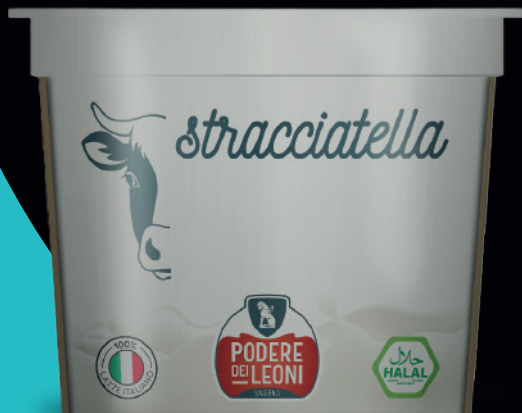
Stracciatella di vacca in bicchiere