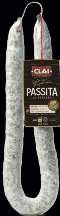
Salsiccia stagionata - Passita si Romagna