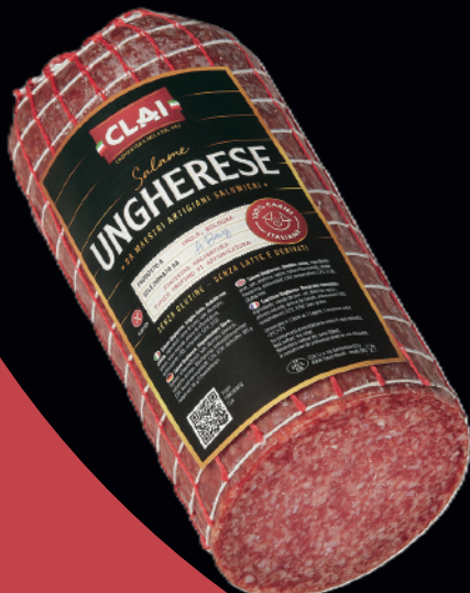
Salame Ungherese bollo rosso