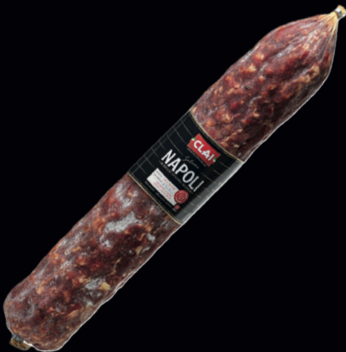
Salame Napoli 3kg