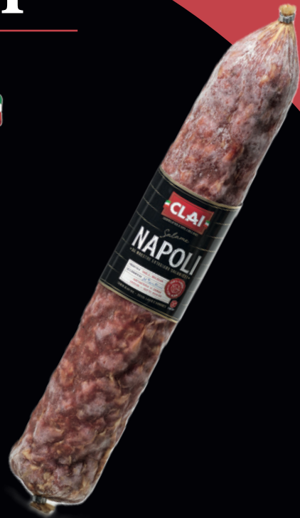
Salame Napoli bollino rosso