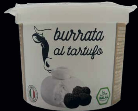
Burrata di vacca tartufata