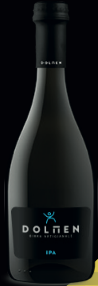
Birra artigianale, stile IPA