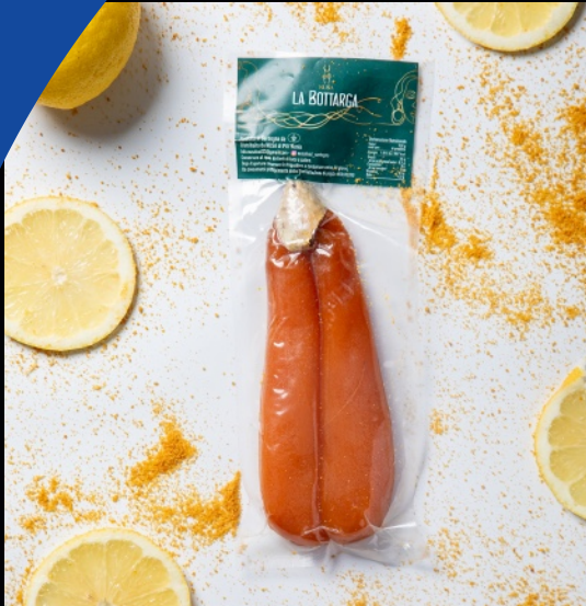
Bottarga, baffa intera