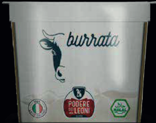
Burrata di vacca