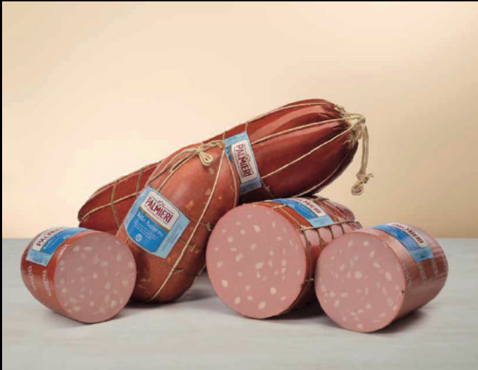
Mortadella Bollo Azzurro