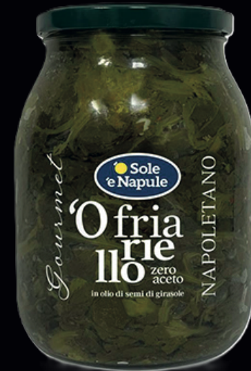
'O friariello, zero aceto, in olio di semi di girasole