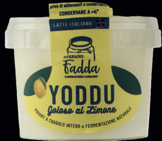
Yoddu al limone