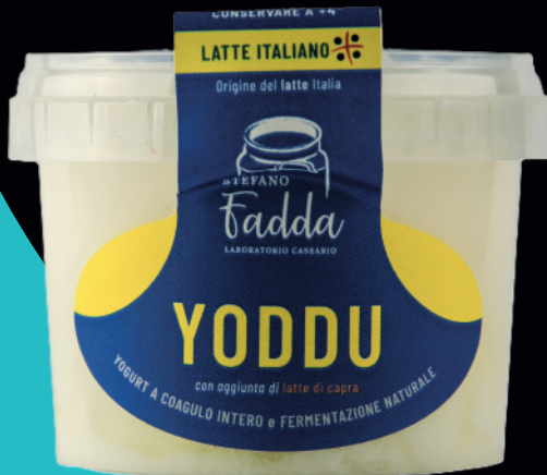
Yoddu di capra