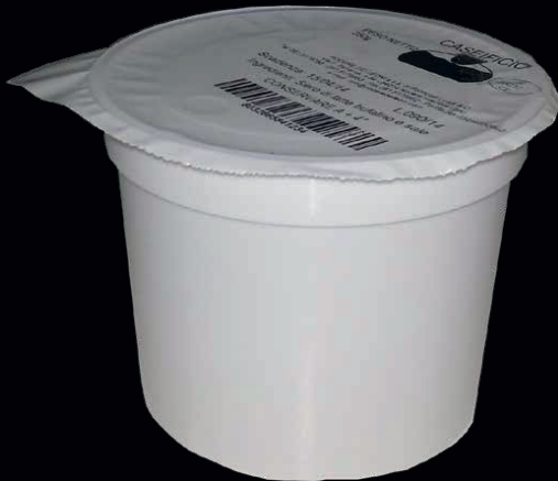
Stracciatella con latte di bufala