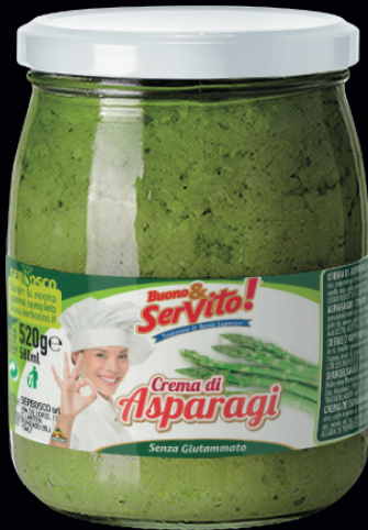
Crema di asparagi