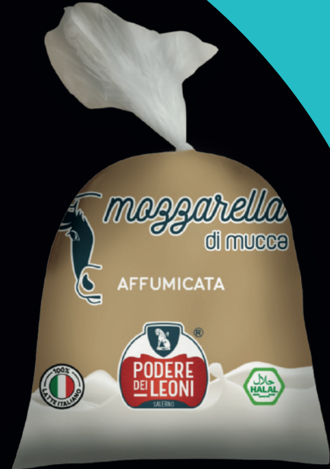
Mozzarella di latte affumicata