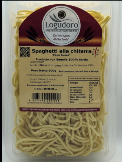
Spaghetti alla chitarra