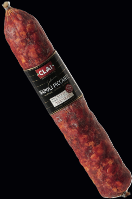
Salame Napoli piccante