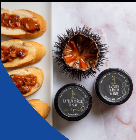
Polpa di riccio di mare