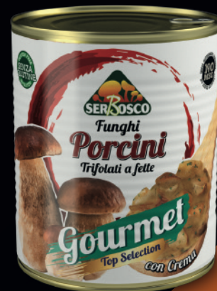
Funghi porcini trifolati e fette - gourmet