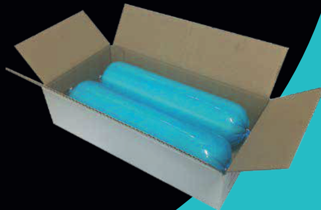
Filone di vacca, normale e affumicato 2KG