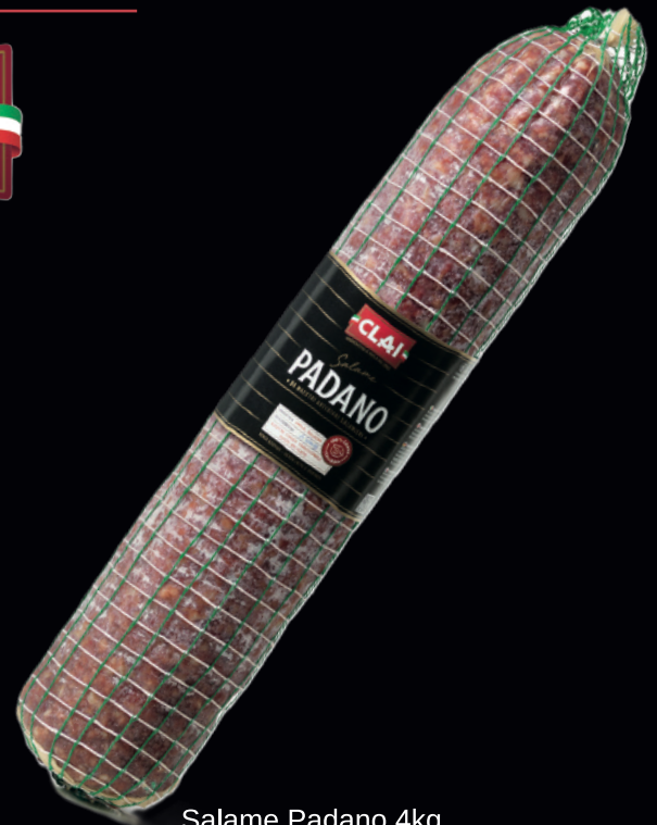
Salame Padano 4kg