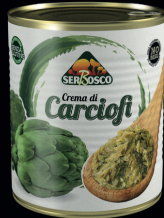
Crema di carciofi