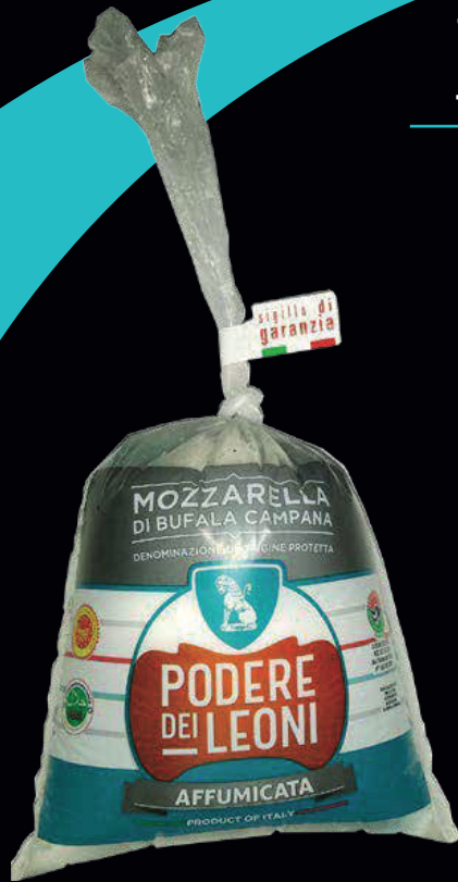
Bufala di bufala campana DOP affumicata