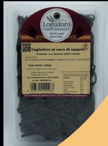
Tagliolino al nero di seppia