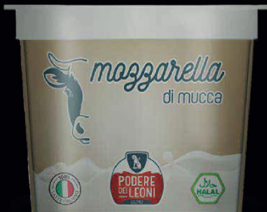
Mozzarella di vacca