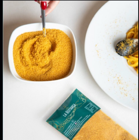
Bottarga in polvere