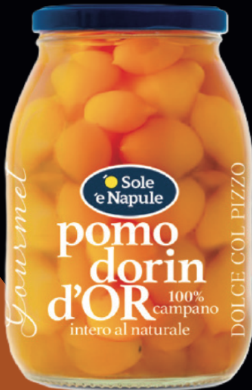
pomodorin d'OR, intero al naturale