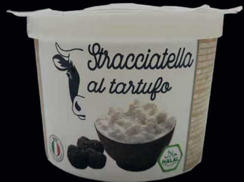
Stracciatella di vacca tartufata