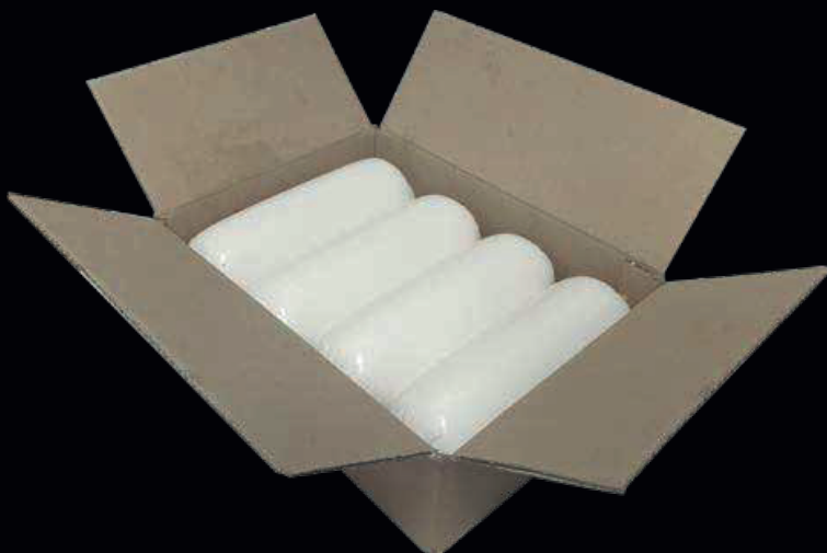
Filone di vacca, normale e affumicato 1KG