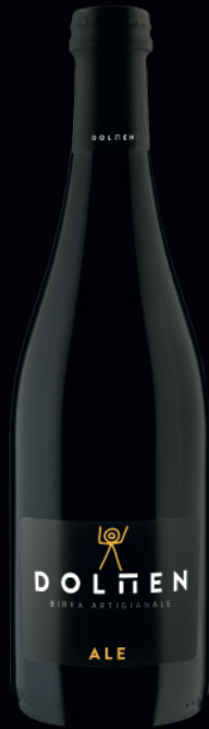
Birra artigianale, stile ALE