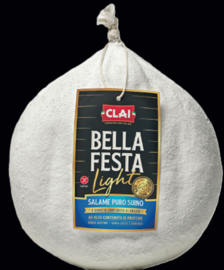
Salame Bella festa light