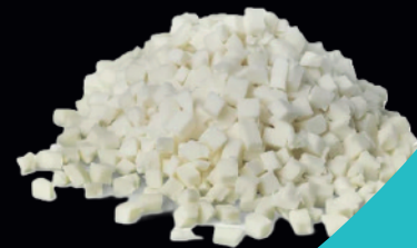
Mozzarella per pizza cubettata e a julienne