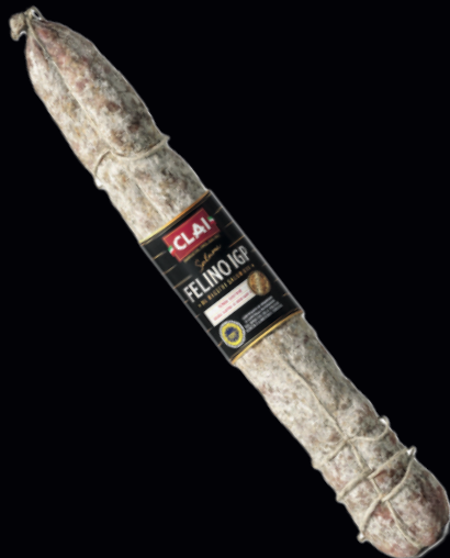
Salame Felino IGP