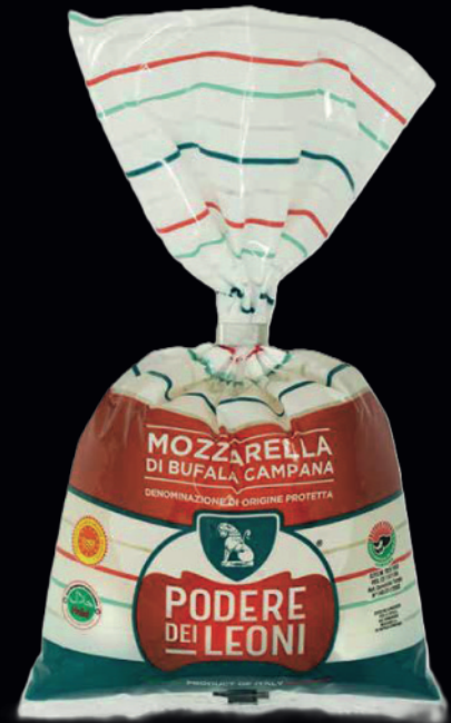
Mozzarella di bufala campana DOP treccia