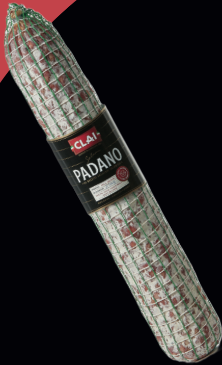
Salame Padano 2kg