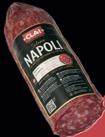
Salame Napoli 3kg