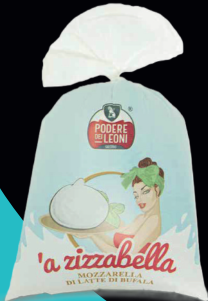
Mozzarella di latte di bufala 1KG