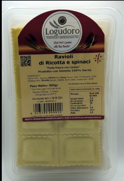
Ravioli di ricotta e spinaci